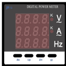
HD 194UIF-AX4 (72x72) HD 194UIF-9X14 (96x96)