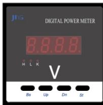
HD 194U-AX1 (72x72) HD 194U-9X1 (96x96)