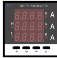
HD 194I-AX4 (72x72) HD 194I-9X4 (96x96)