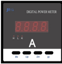
HD 194I-AX1 (72x72) HD 194I-9X1 (96x96)