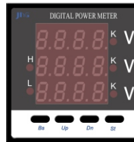
I 5 Ü-AX4 (72x72) HD 194U-9X4 (96x96)